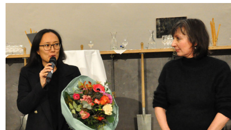
Die Gewinner des Ideenwettbewerbs «Perspektive Sternstunde Kunst»