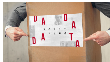
Interaktive Webdok: «Dada-Data»